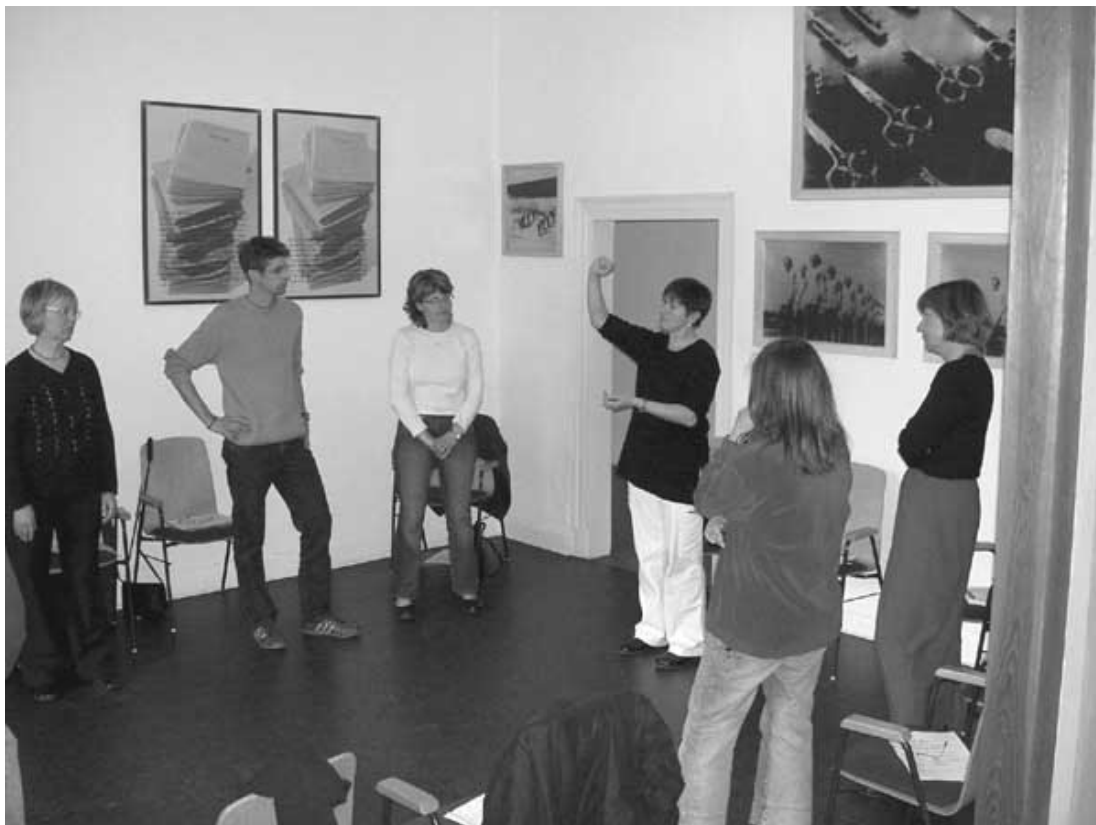
Teilnehmer bei einer Übung beim Workshop "STUPS" im Mai 2005 in der Gedenkstätte Breitenau